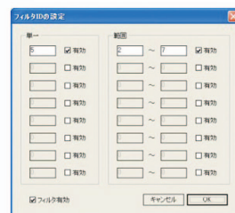
[フィルタ設定画面]